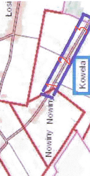
MAPA DO CELÓW PROJEKTOWYCH 2(3)