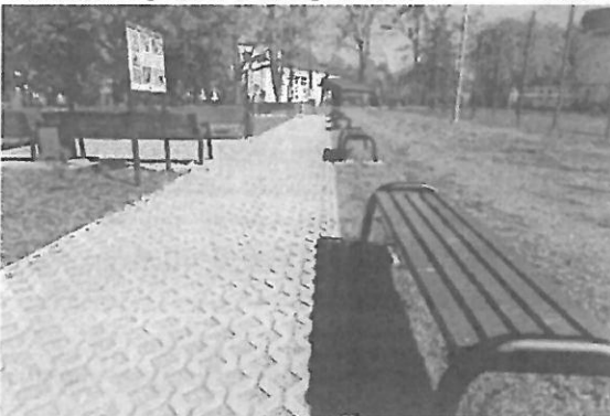
Ławki, kosze na śmieci, chodnik ażurowy betonowy oraz tablice informacyjne