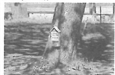
Budka dla owadów