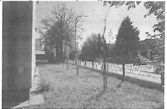
Nasadenia dojrzalych drzew - dęby