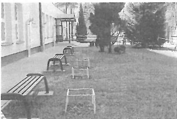
Lawki przed budynkiem szkoły