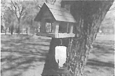
Karmnik dla ptaków wraz z poidelkiem