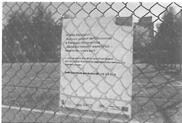
Plakat w miejscu realizacji projektu