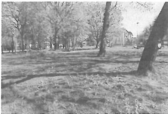
Nasadzenia paprotnika oraz bluszczu