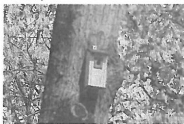
Budka lęgowa dla ptaków