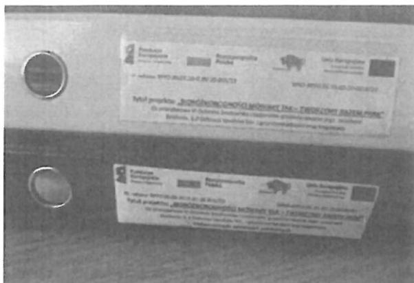
Segregatory, w których przechowywana jest dokumentacja dotycząca projektu