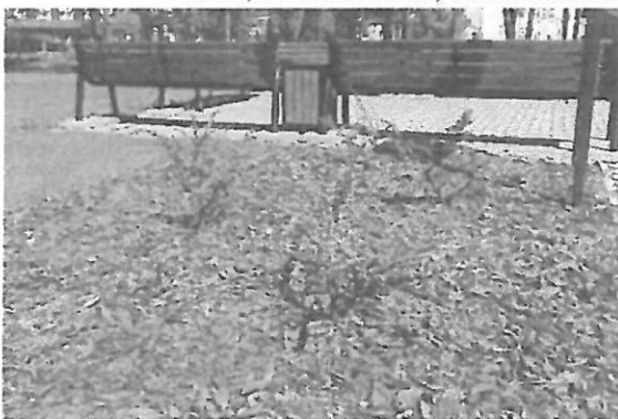
Nasadenia krzewów irgi