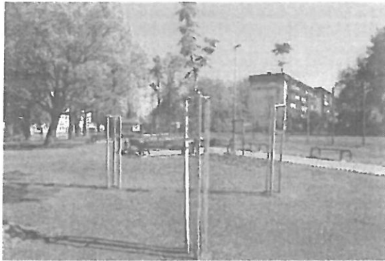
Nasadenia dojrzalych drzew- klony